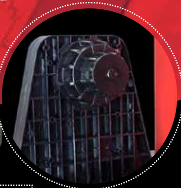
Porta rollos (100m lineales)