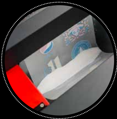
Aplicación del adhesivo

Esta nueva tecnología de impresión nos permite tanto imprimir cuatricomías sin necesidad de crear una pantalla por color, como degradados con facilidad, manteniendo una alta producción autónoma sin la necesidad de que un operario tenga que cortar o pelar vinilos previamente a su aplicación.