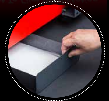
Bandeja de recogida

El tren de trabajo se compone de un desbobinador, una impresora de 30cm de ancho de entrada de material y un horno de secado con rebobinador. Gracias a este último, podemos aplicar fácilmente la cola en polvo y curar el material antes de volver a rebobinarlo y así poder imprimir hasta 100 metros lineales sin preocupación de ir cambiando hojas unitarias ni aplicar el acabado manualmente.